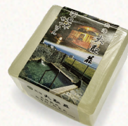
大観荘オリジナル「温泉石鹸」